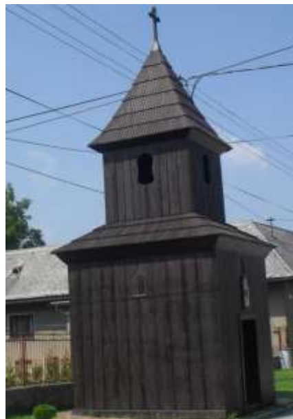
Obrázok č. 3: Drevená zvonica z prvej polovice 19. storočia

Drevená zvonica so štvorcovým pôdorysom a v stavanou vežou, šalovaná, debnená, s nadstavcom, vysadenou izbicou a ihlanovou strechou bola postavená v polovici 19. storočia. Vo výklenku bola v minulosti ľudová socha, kópia Piety z Tužiny z 1. polovice 19. storočia. Vo veži je zvon z roku 1783, ktorý je od roku 2010 v zozname národných kultúrnych pamiatok. V obci je niekoľko kamenných sypární a drevených krížov z 20. storočia.