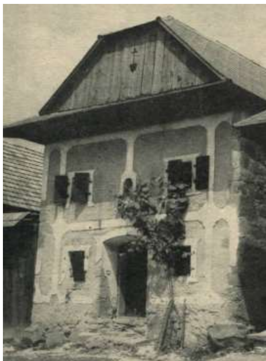
Obrázok č. 4: Kamenná sypáreň (pri dome č. 78)