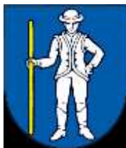
Obrázok č. 1: Erb obce Lipník

Súčasný erb obce vychádza z historickej pečate Lipníka a zobrazuje v modrom štíte stojaceho striebroodetého muža v klobúku, v čižmách, s ľavou rukou vbok a v pravici drží dlhú zlatú palicu (pravdepodobne predstavuje gazdu alebo richtára).