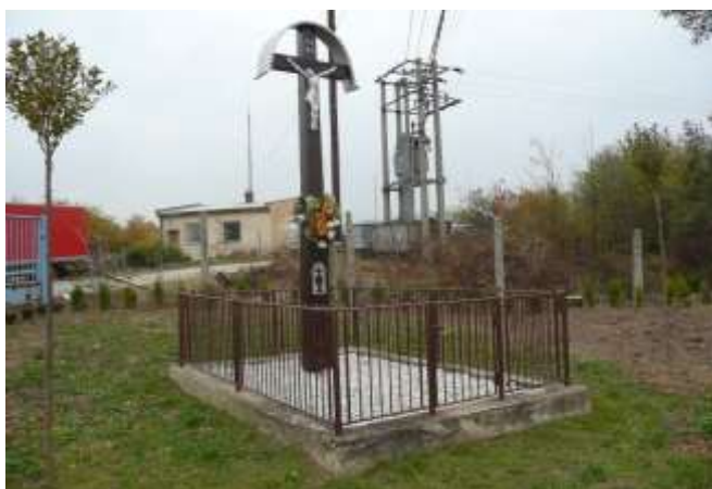
Obrázok č. 5: Obnovený drevený kríž (pri býv. družstve)