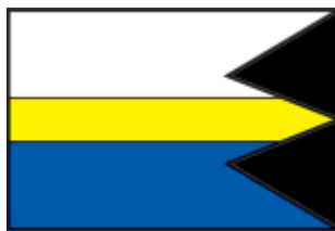
Obrázok č. 2: Vlajka obce Lipník

Vlajka obce je bielo-žlto-modrá s pomerom strán 2:1:2 a ukončená je rovnomerným trojcípovým chvostom.