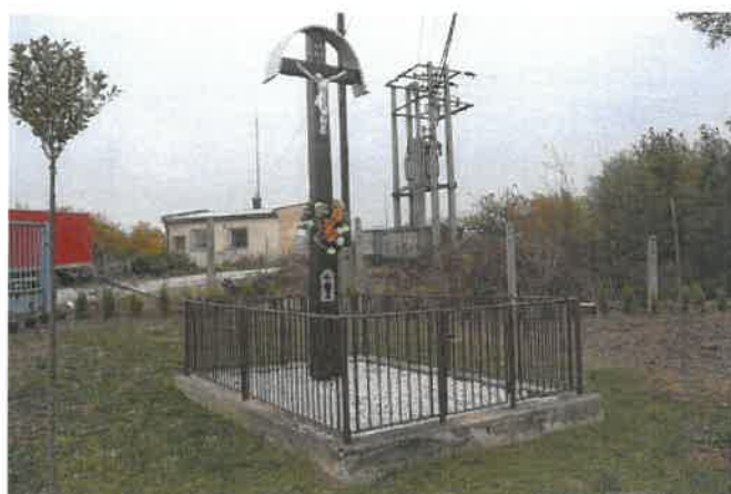
Obrázok č. 5: Obnovený drevený kríž (pri býv. družstve)