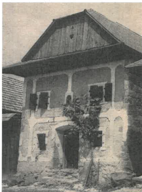
Obrázok č. 4: Kamenná sypáreň (pri dome č. 78)