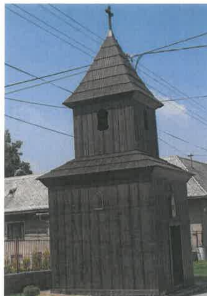
Obrázok č. 3: Drevená zvonica z prvej polovice 19. storočia

Drevená zvonica so štvorcovým pôdorysom a v stavanou vežou, šalovaná, debnená, s nadstavcom, vysadenou izbicou a ihlanovou strechou bola postavená v polovici 19. storočia. Vo výklenku bola v minulosti ľudová socha, kópia Piety z Tužiny z 1. polovice 19. storočia. Vo veži je zvon z roku 1783, ktorý je od roku 2010 v zozname národných kultúrnych pamiatok. V obci je niekoľko kamenných sypární a drevených krížov z 20. storočia.