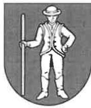
Obrázok č. 1: Erb obce Lipník

Súčasný erb obce vychádza z historickej pečate Lipníka a zobrazuje v modrom štíte stojaceho striebrodetého muža v klobúku, v čižmách, s ľavou rukou vbok a v pravici drží dlhú zlatú palicu (pravdepodobne predstavuje gazdu alebo richtára).