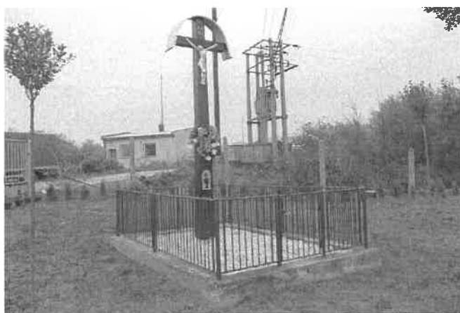
Obrázok č. 5: Obnovený drevený kríž (pri býv. družstve)