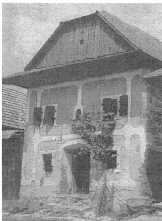
Obrázok č. 4: Kamenná sypáreň (pri dome č. 78)