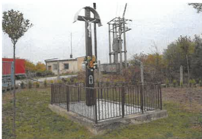
Obrázok č. 5: Obnovený drevený kríž (pri býv. družstve)