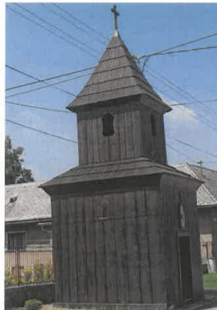
Obrázok č. 3: Drevená zvonica z prvej polovice 19. storočia

Drevená zvonica so štvorcovým pôdorysom a v stavanou vežou, šalovaná, debnená, s nadstavcom, vysadenou izbicou a ihlanovou strechou bola postavená v polovici 19. storočia. Vo výklenku bola v minulosti ľudová socha, kópia Piety z Tužiny z 1. polovice 19. storočia. Vo veži je zvon z roku 1783, ktorý je od roku 2010 v zozname národných kultúrnych pamiatok. V obci je niekoľko kamenných sypární a drevených krížov z 20. storočia.