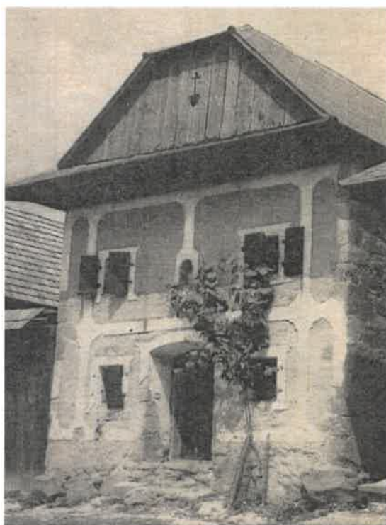
Obrázok č. 4: Kamenná sypáreň (pri dome č. 78)