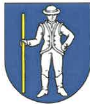
Obrázok č. 1: Erb obce Lipník

Súčasný erb obce vychádza z historickej pečate Lipníka a zobrazuje v modrom štíte stojaceho striebroodetého muža v klobúku, v čižmách, s ľavou rukou vbok a v pravici drží dlhú zlatú palicu (pravdepodobne predstavuje gazdu alebo richtára).