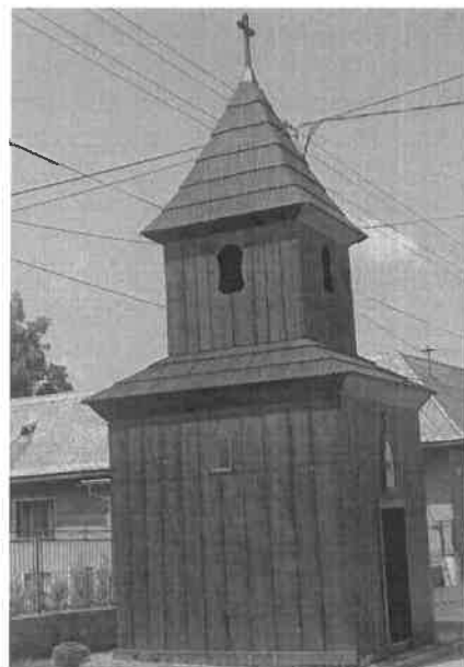
Obrázok č. 3: Drevená zvonica z prvej polovice 19. storočia

Drevená zvonica so štvorcovým pôdorysom a v stavanou vežou, šalovaná, debnená, s nadstavcom, vysadenou izbicou a ihlanovou strechou bola postavená v polovici 19. storočia. Vo výklenku bola v minulosti ľudová socha, kópia Piety z Tužiny z 1. polovice 19. storočia. Vo veži je zvon z roku 1783, ktorý je od roku 2010 v zozname národných kultúrnych pamiatok. V obci je niekoľko kamenných sypární a drevených krížov z 20. storočia.