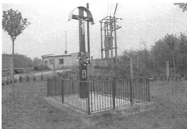
Obrázok č. 5: Obnovený drevený kríž (pri býv. družstve)