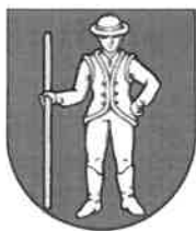
Obrázok č. 1: Erb obce Lipník

Súčasný erb obce vychádza z historickej pečate Lipníka a zobrazuje v modrom štíte stojaceho striebroodetého muža v klobúku, v čižmách, s ľavou rukou vbok a v pravici drží dlhú zlatú palicu (pravdepodobne predstavuje gazdu alebo richtára).