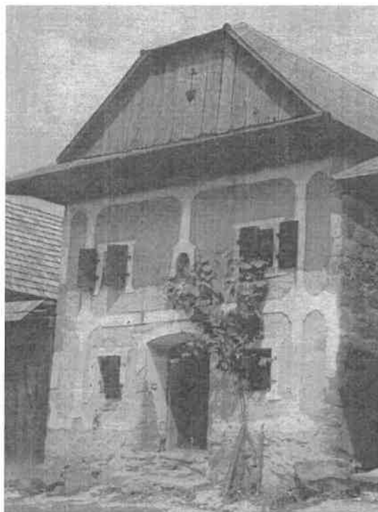
Obrázok č. 4: Kamenná sypáreň (pri dome č. 78)